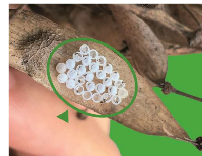
Masa de huevo s eclosada, Halyomorpha halys .